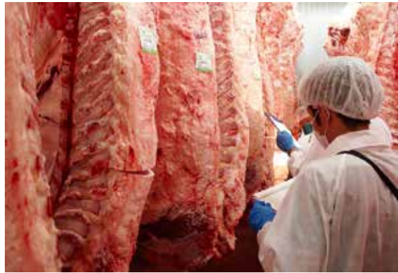
枝肉を確認する関係者

JA南さつまは七月二十三日、南九州市知覧町の(株)JA食肉かごしま南薩工場で、平成三十年度第一回JA南さつま12D飼料肉牛枝肉共励会を開催しました。