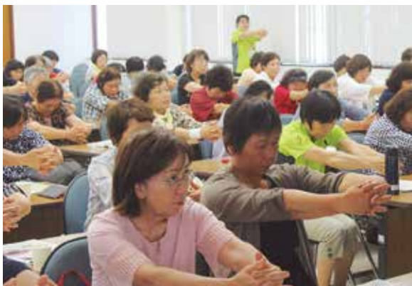
介護予防運動をする会員ら

また、DVDを見ながら、介護予防運動である「てんとうムシ体操・みつばち体操」を行い、楽しみながら運動しました。