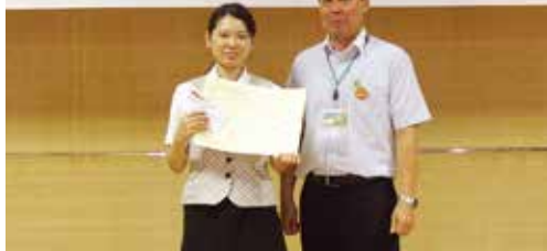
最優秀賞に輝いた本所チーム

JA南さつまは川辺支所で7月14日、金融窓口での顧客対応やセールス力を競う、第3回JA南さつま窓口ロールプレイング大会を開催しました。JA各店舗から18組36人が出場し、審査の結果、最優秀賞に本所が輝きました。