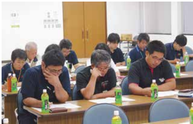
協議に臨む営農指導員ら

JA南さつま営農指導員協議会は七月二十七日、JAふれあいセンターで第二十回総会を開催し、約三十人が出席しました。