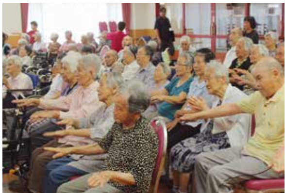
一緒に踊る入居者ら