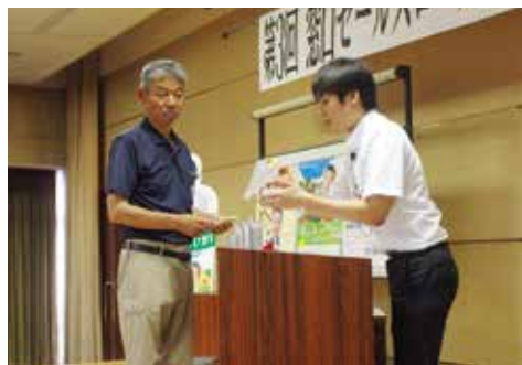
ロールプレイングを行う出場者