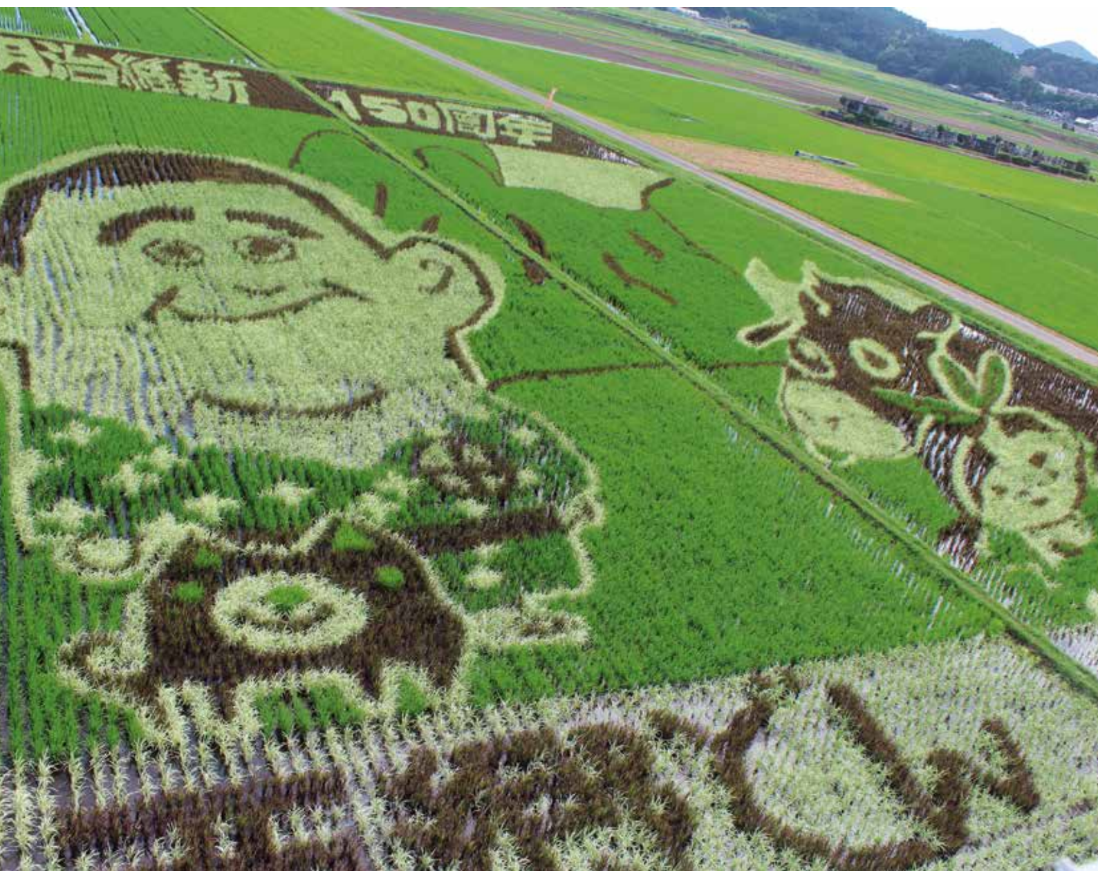
田んぼアート (南九州市川辺町)