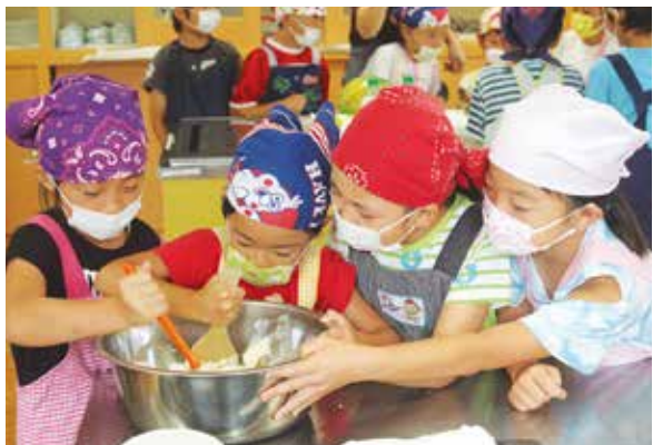
料理に挑戦する児童ら