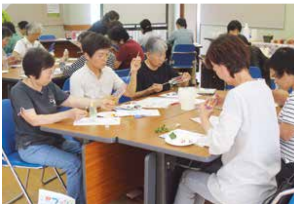
ハーバリウム作りを行う会員ら

会員らは、好みの花を選んで丁寧に飾り付けをし、専用のオイルを入れ楽しみながらハーバリウム作りに取り組みました。